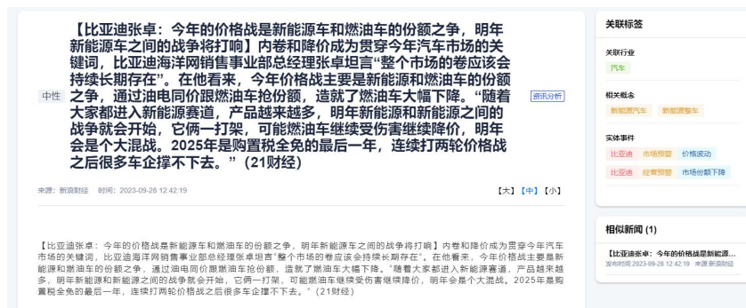
图 3 上市公司监管公司舆情页

为此，将模型部署到行业云智能舆情系统，依托该系统的数据库进行数据精选。行业云智能舆情系统每日入库数据量约 8 万条，通过实体识别可以将单家公司相关舆情范围