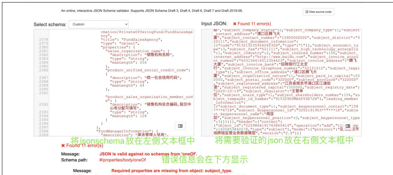
图 D.1 在线格式校验参考