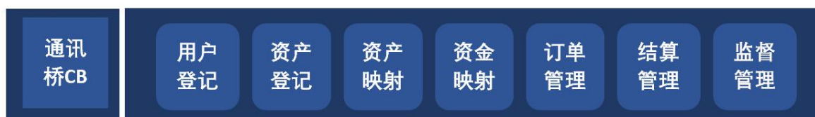
图3 通讯桥的逻辑结构