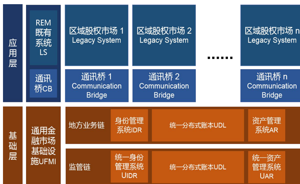
图1 区域性股权市场的双层架构

区域性股权市场REM的既有系统LS(通过通讯桥CB)与通用金融市场基础设施UFMI共同构成两层体系:应用层与基础层,见图1。