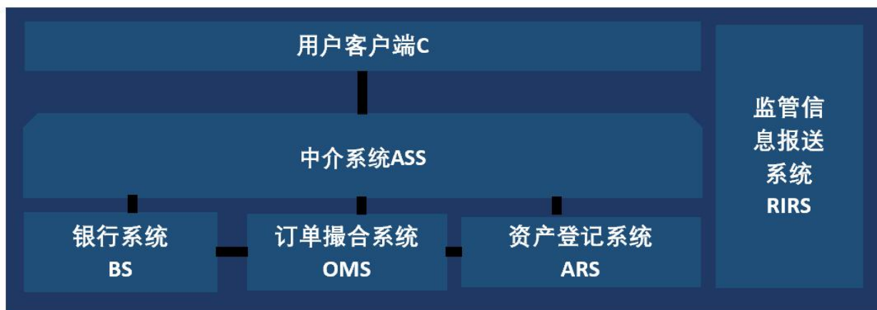
图2 既有系统的逻辑结构